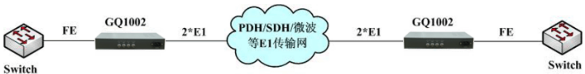
方案一：点对点组网